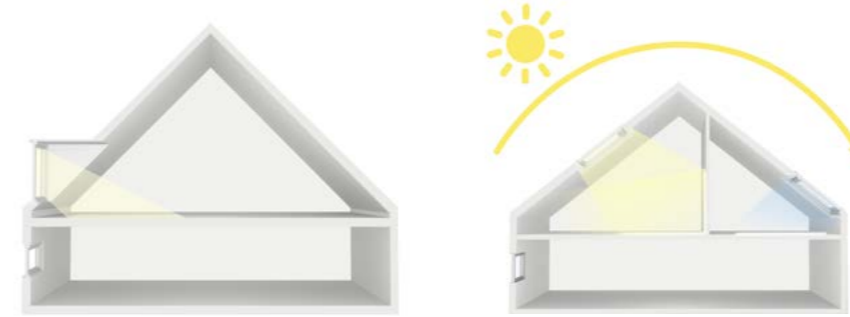
Une ouverture inclinée fait entrer plus profondément la lumière dans la pièce qu'une lucarne